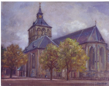
Oldenzaal, Sint Plechelmuskerk