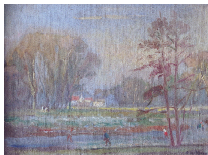
Schaatsen op de vijver van Duin en Daal (1922)