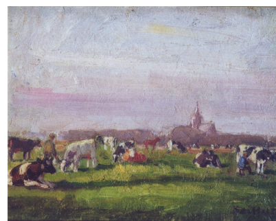
Melktijd in de Beemster (1930)