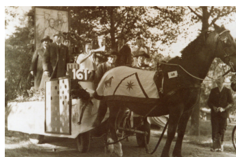
Foto van de praalwagen, ca. 1937