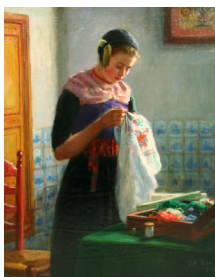
Handwerkend Staphorster meisje, 1914.

Dit jaar zijn bij de Stichting twee 'nieuwe' werken van De Heer bekend geworden: Het schilderij Vlieland (ca. 1915, in particulier bezit) en het handwerkend Staphorster meisje (1914), dat bij een veiling is verkocht en een zeer mooi bedrag heeft opgebracht.