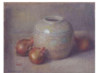
Gemberpot met uien (Een van de werken die voor de verkoop zijn ingelijst)