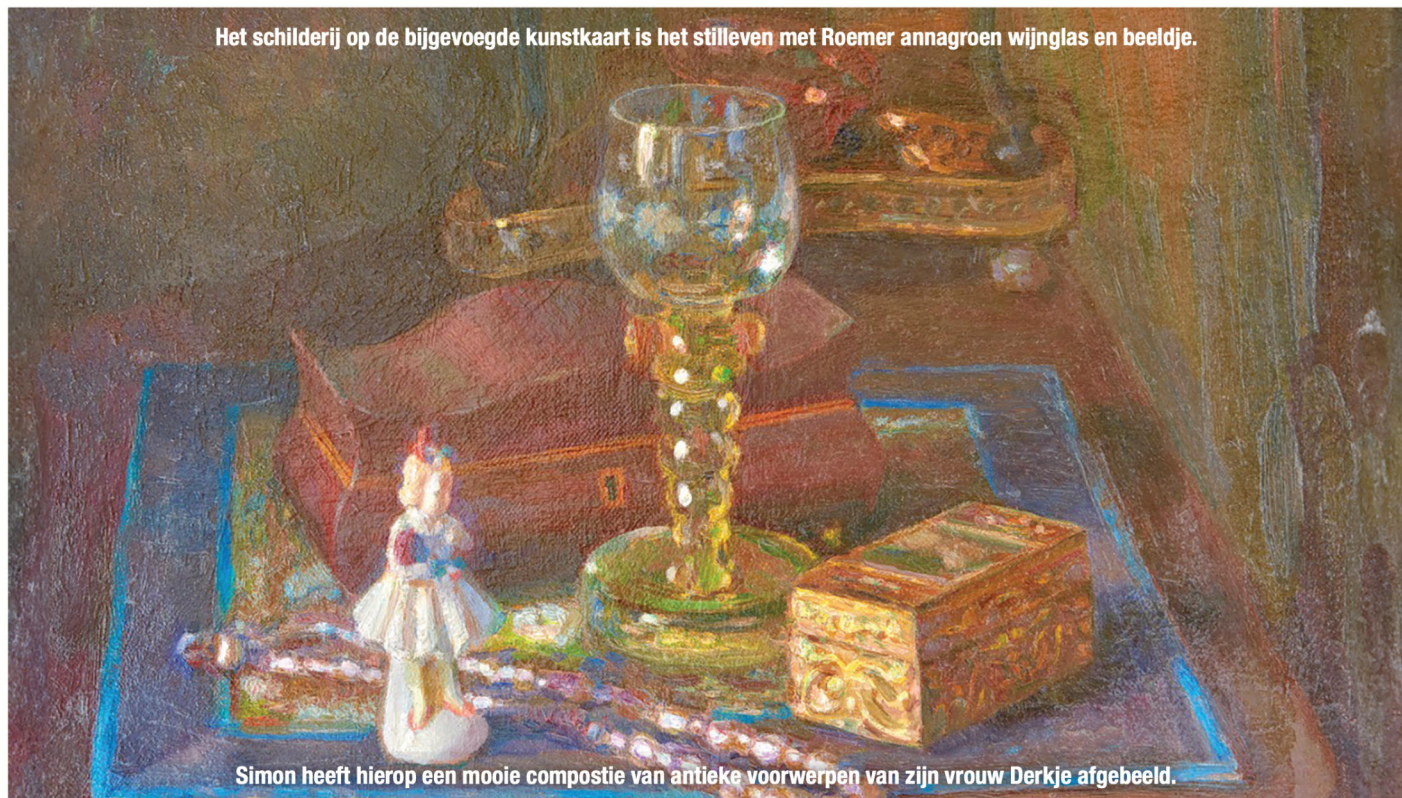
Het schilderij op de bijgevoegde kunstkaart is het stilleven met Roemer annagroen wijnglas en beeldje.