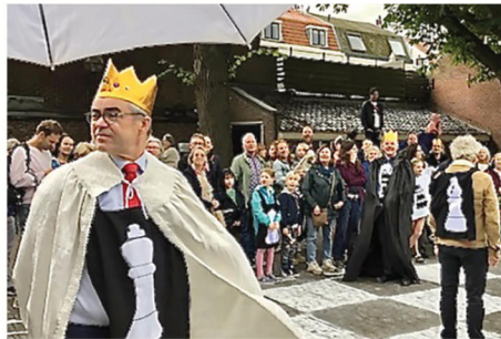
Impressie van het levende schaakspel