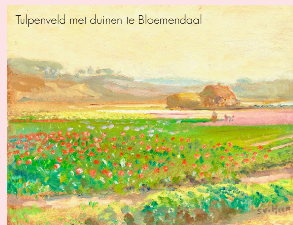
Tulpenveld met duinen te Bloemendaal