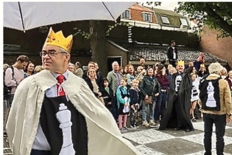
Impressie van het levende schaakspel